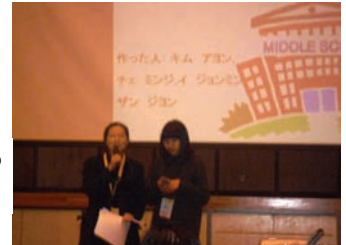
豊里中学校での発表