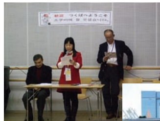
ご協力ありがとうございました。

また、今回ホストファミリーを快く引き受けてくださったご家庭、通訳ボランティアを引き受けてくださった方々