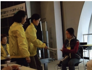
ボランティアさん頑張ってます