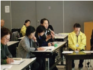
審査員さん真剣です