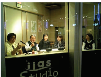
World Talkerの様子 イーアスオープンスタジオにて