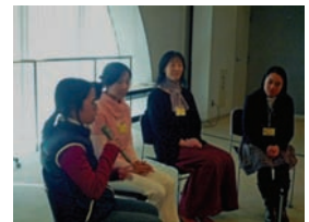
初中級本選の様子

また、この大会を支えてくださった、審査員、運営ボランティアの皆様のご理解、ご協力いただきまして、本当にありがとうございます。