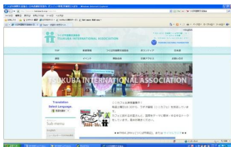
つくば市国際交流協会 HP

どなたか、良いアイデアのある人、この事業を一緒にやってみてみたい人がありましたら、ぜひともつくば市国際交流協会までご連絡ください。